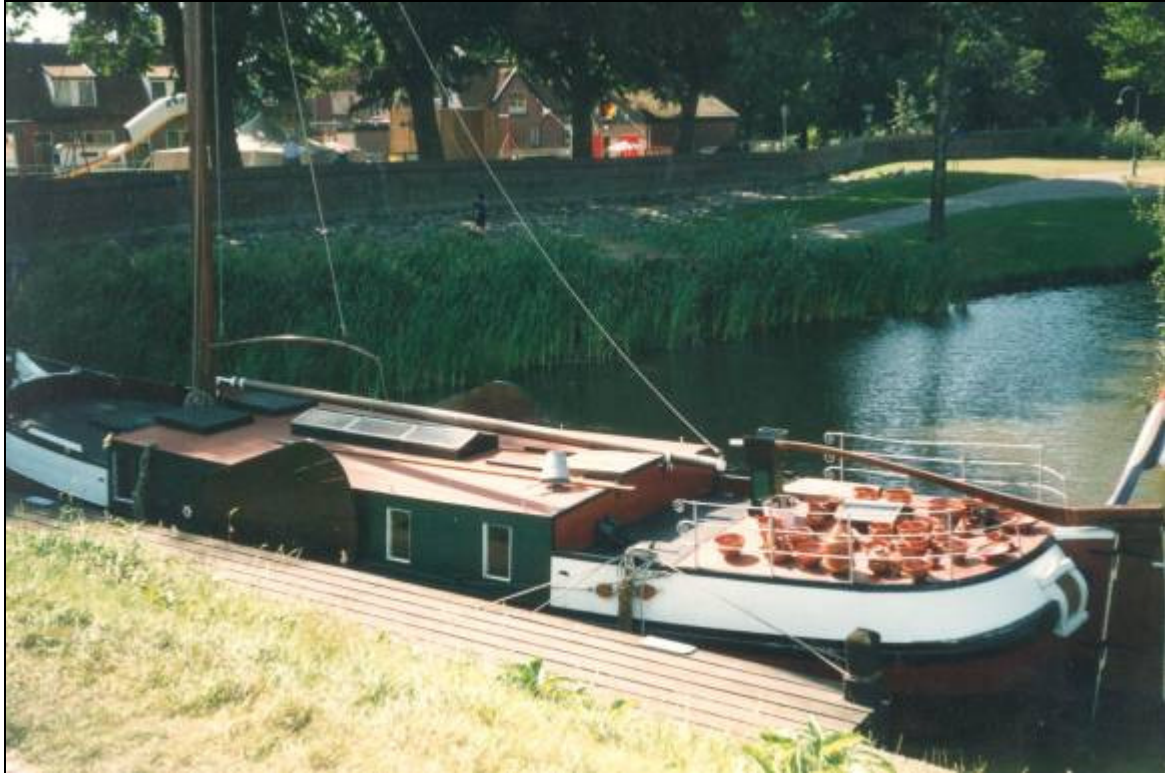
Potschip in Zuiderzeemuseum. Foto door de auteur

Het gezin moet een weinig honkvast beslaan geleid hebben. De thuisbasis bleef heel lang Veenwouden. Tjalling begon aan een reeks beroepen, van 'boereknecht' tot dagloner en potschipper. Alle kinderen kwamen uiteindelijk goed terecht, alleen Sijke en Sierk blijven ongehuwd. Zij namen uiteindelijk het schip, 'De Hoop' over. Zo'n potscheepje was zeer klein en de omstandigheden aan boord zullen bepaald niet gemakkelijk geweest zijn. Er valt in het leven van Sjoerdje ook leed te verwerken. Nog tijdens Tjallings leven verliezen zij kinderen: Neeltje overlijdt in 1858, Fokje in 1862 en Aaltje in 1867. Toen was Tjalling trouwens ook al overleden. Het gezin was op 6 november 1865 officieel verhuisd van Dantumadeel naar Oostermeer, nabij Bergum in de gemeente Tietjerksteradeel. Daar sterft Tjalling Sierks van der Woude op 23 januari 1866 'des morgens ten tien ure, in een schip'. Sjoerdje zelf behoorde tot de zeer sterken. Zij leeft nog een fiks aantal jaren in Bergum, naar ik aanneem samen met Sijke en Sierk op het schip. Ze overlijdt tenslotte op de gezegende leeftijd van ruim 89 jaren.