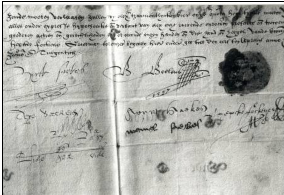
Achterkant van de akte van scheiding, met ondertekening door Sierck Saeckes, Teye Saeckes, Arent Saeckes, Weemel Saeckedr (gesterkt met haar man, Broer Boelens) en Hepcke Fockens.

Zodoende zijn de lucratieve ambten in het Opsterlandse eigenlijk gedurende lange tijd aan de families gekoppeld. Zo zal de familie Fockens gedurende anderhalve eeuw het grietmansambt vervullen, terwijl de familie Van Teyens vanaf 1588 met een korte onderbreking bijna een eeuw de secretaris mag leveren en later nog bijna een kwart eeuw (1777-1796).