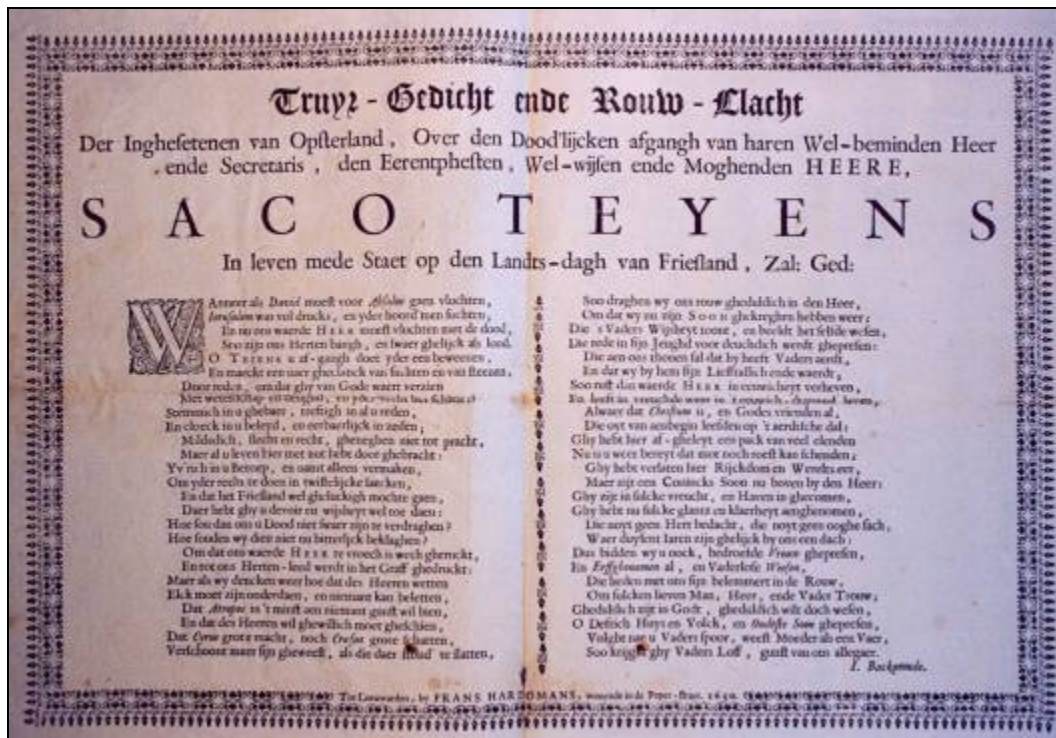
I. Backamude: 'Truyr-Gedicht ende Rouw-Clacht'. 32