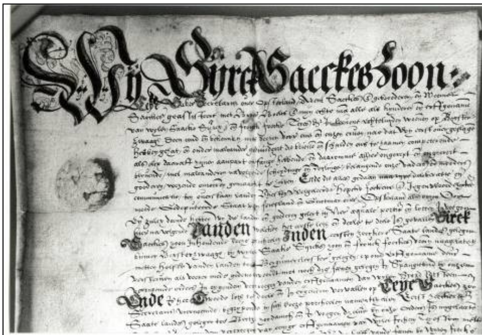
Voorzijde van de akte van scheiding d.d. 1 april 1597 tussen de vier dan nog levende kinderen van Saecke Siercks en Frouck Focke Teyesdr. 4

Uit die ambtelijke loopbaan van Saecke Siercks is in ieder geval één interessant document bewaard gebleven: in die functie van bijzitter ondertekent Saecke Siercks namelijk op 17 juli 1579 mede de akte, waarin Opsterland zich aansluit bij de Unie van Utrecht. 3