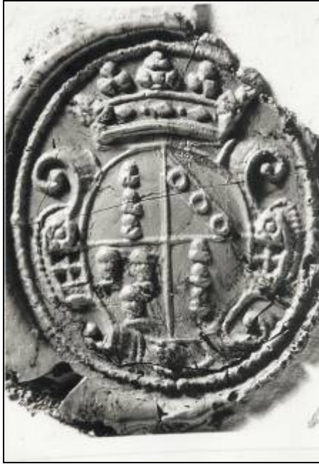
Alliantiewapen (uitvergroot) van het echtpaar Van Teyens-Van Besten.