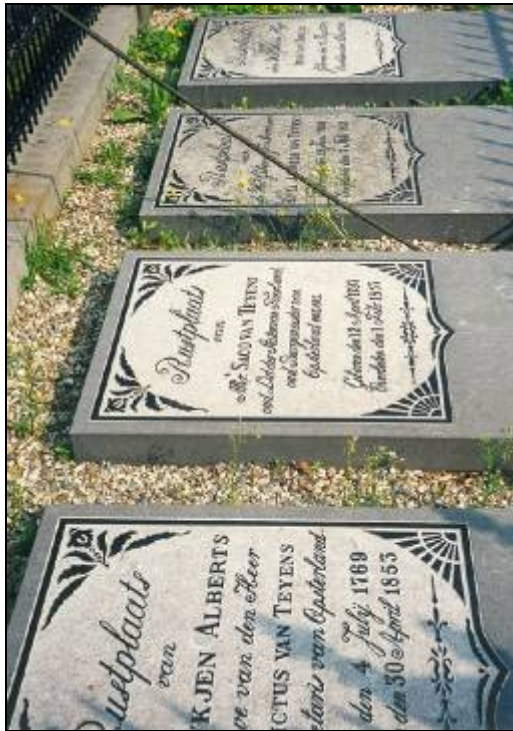
Graven te Beetsterzwaag van Froukje Alberts en haar drie kinderen.