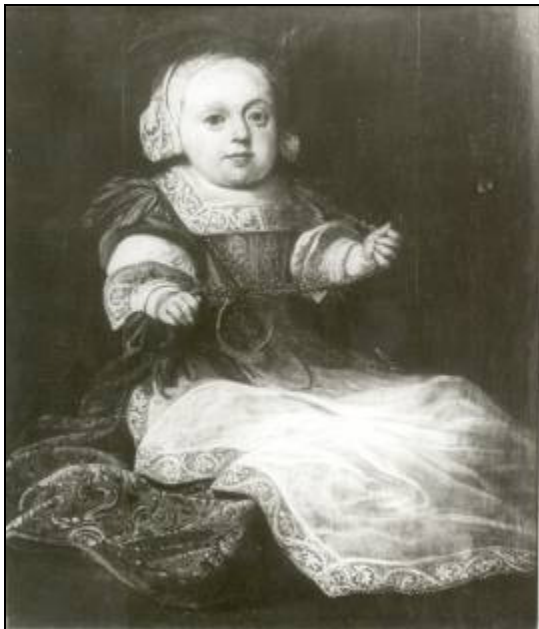
Saco van Teyens (geb./overl. 1675).